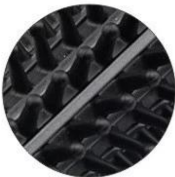
Optional 1: All plastic teeth