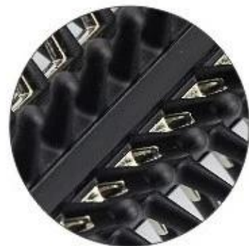
Optional 3: Half plastic teeth & half metal teeth