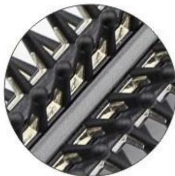
Optional 2: All metal teeth