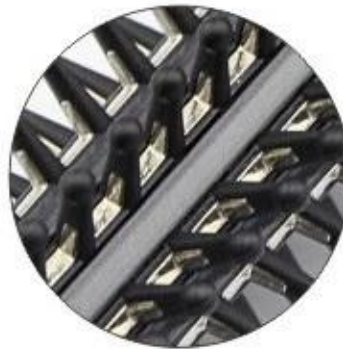
Optional 2: All metal teeth