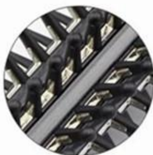
Optional 2: All metal teeth