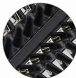
Optional 3: Half plastic teeth & half metal teeth