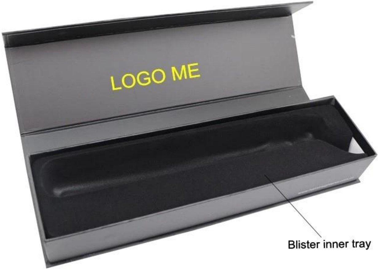
Blister inner tray