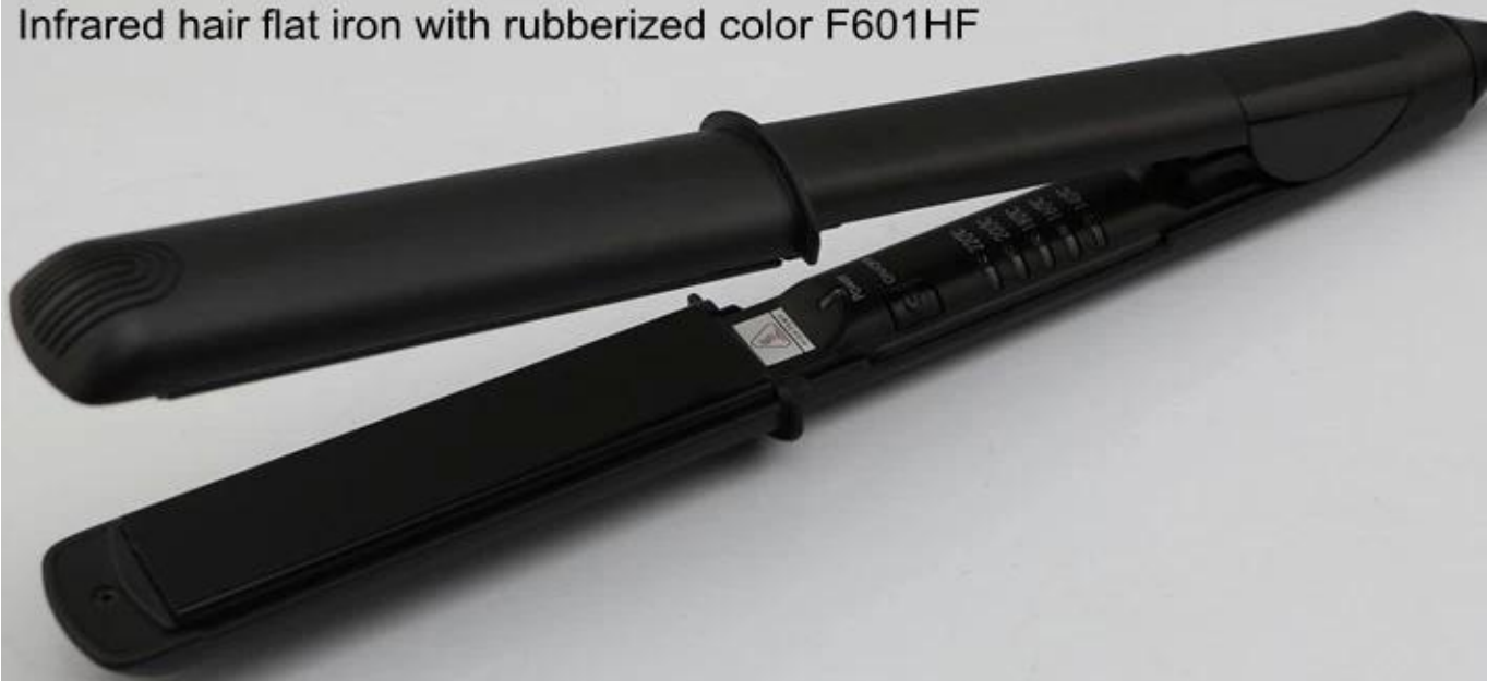
Infrared hair flat iron with rubberized color F601HF