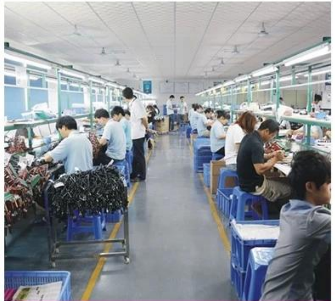
ASSEMBLY LINE 1