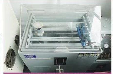
Salted steam testing machine