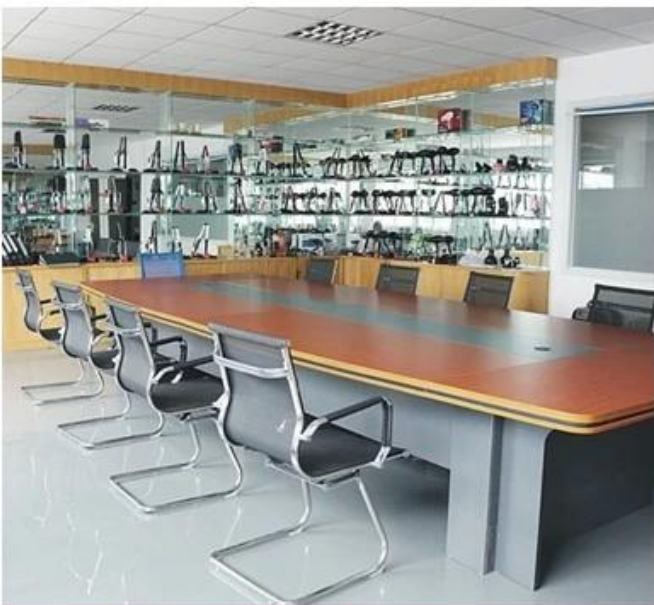
Meeting and show room