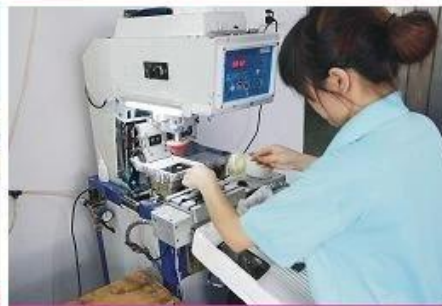
LOGO printing machine 2