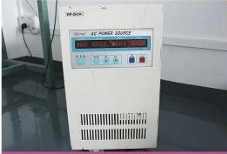
AC power source 1