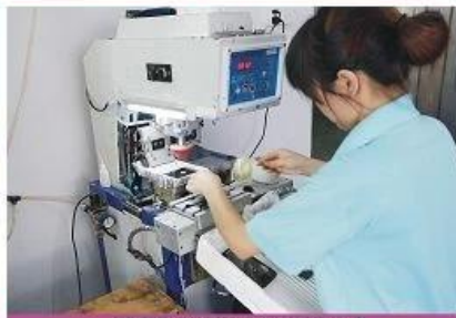
LOGO printing machine 2