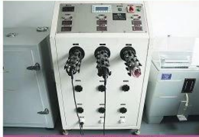
Power cord flexing test system