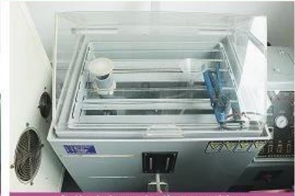
Salted steam testing machine