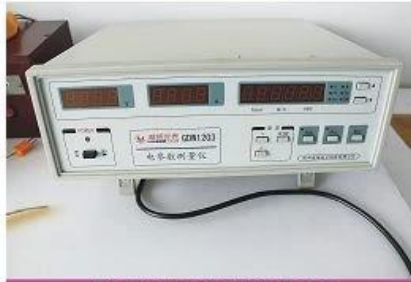
Electrical parameter tester