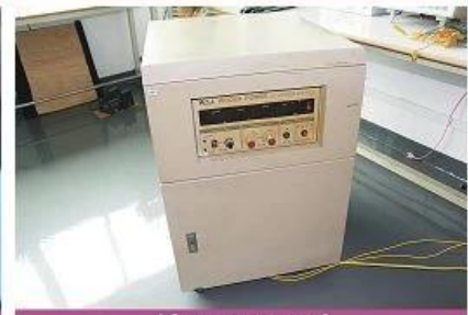
AC power source 2