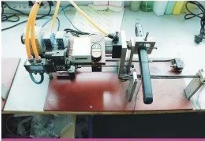
Life test machine