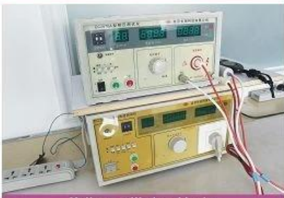
Voltage withstand tester