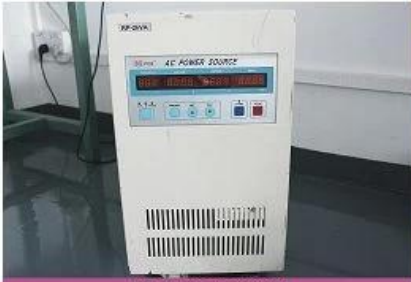
AC power source 1