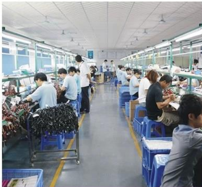
ASSEMBLY LINE 1