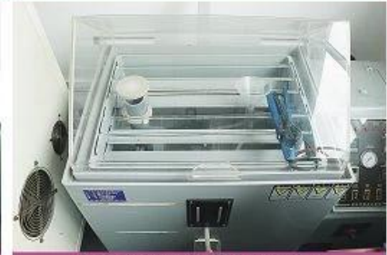
Salted steam testing machine