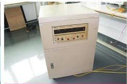
AC power source 2