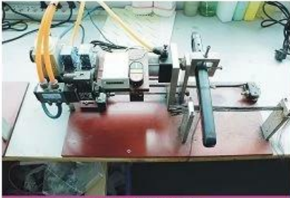
Life test machine