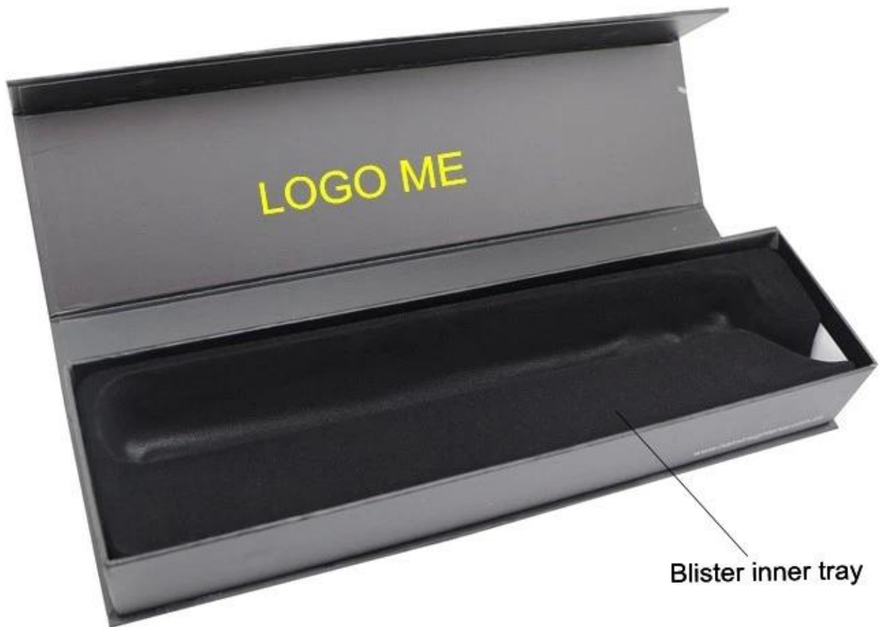
Blister inner tray